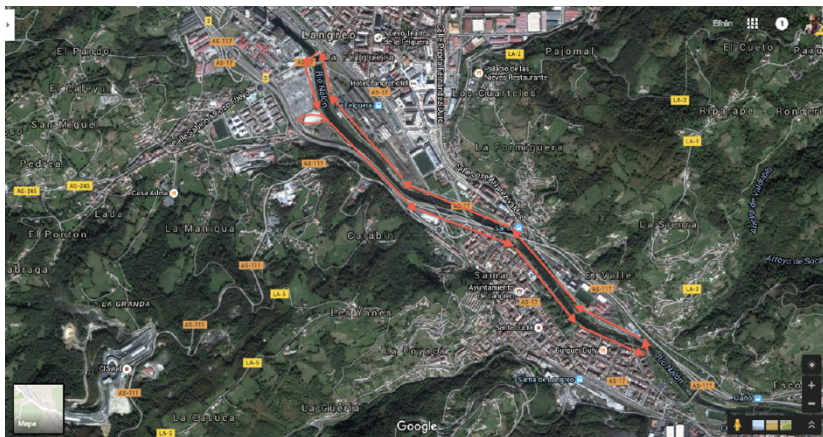
Plano del recorrido de la prueba.

La prueba de cinco kilómetros ( POR ASFALTO ) con salida y meta en los alrededores de la pista de atletismo de Lada, discurrirá casi íntegramente por el paseo que discurre paralelo al río Nalón. Los corredores se dirigirán hacia Sama por el dicho paseo llegando al puente de hierro. Seguirán por el Parque de Sama hasta el Adaro donde cruzarán el puente de la Montera para regresar a Lada por la otra orilla. Otra vez el cruce del puente de hierro, donde la sidrería La Mula Torna. Siguiendo ya todo el paseo hasta el puente de Lada, en dirección a la Pista de Lada donde para terminar en el mismo punto de salida. Puede sufrir modificaciones por motivos organizativos, siempre manteniendo la misma distancia.